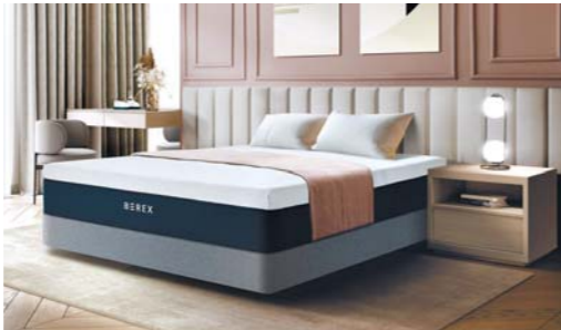
코웨이 비렉스 스마트 매트리스 S5.

신체 부위별 눌림 차이를 감지하는 자동 체압 분산 시스템을 통해 편안한 수면 상태를 유